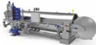
Sterilisation im Behälter