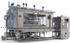
Füllen / Verschließen