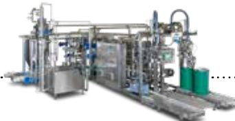
READYGo™ ASEPTISCHER MONOBLOCK