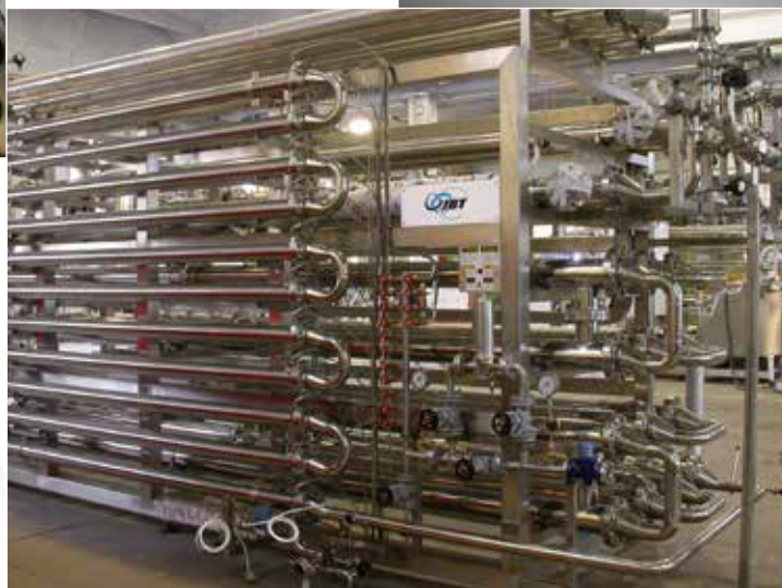
Sterideal® DR (Regeneración Directa)