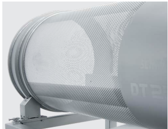
Trommel mit Lochung für den Lakeabfluss