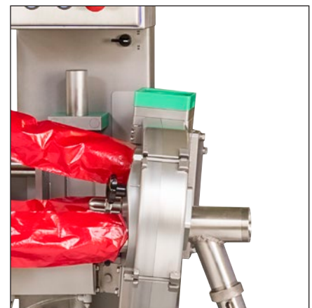
Triple revólver para un trabajo más rápido