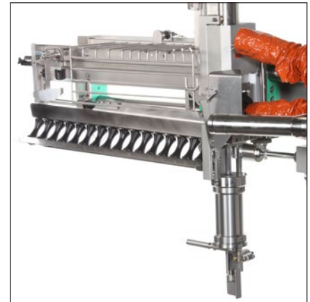
Porcionamiento posible mediante un tope longitudinal