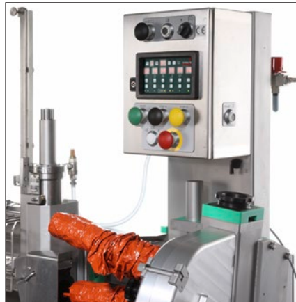
De fácil manejo gracias a un teclado protegido por lámina

TC4357 es la clipeadora automática perfecta para su aplicación en la industria de productos cárnicos para el embutido de salchichas crudas y escaldadas, con y sin complementos, jamón cocido así como carne moldeada en tripas de fibras revestidas o sintéticas. El recorrido corto de la pasta de carne de la TC4357 garantiza un patrón de corte inmejorable. El efectivo cabezal triplete permite un cambio rápido de la tripa, lo que es particularmente útil para envoltorios largos de productos. La construcción ergonómica se ha concebido para facilitar el trabajo. Las etapas de trabajo consecutivas como embutido, separación, clipeado y rotación se pueden adaptar entre sí de modo eficiente. La memoria electrónica permite una reproducción y gestión estructuradas de los datos de producción. El mando neumático de accionamiento se efectúa por medio de un microprocesador.