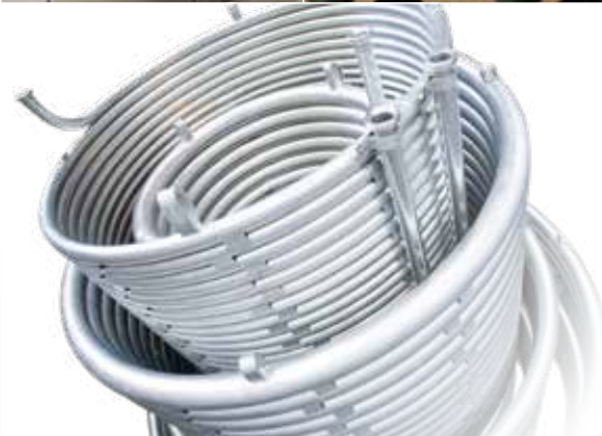
Sterideal® Coil SteriTwin-Coil™