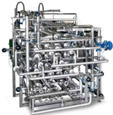
Типичное оборудование Sterideal® TS, QT, DT, DR Теплообменники