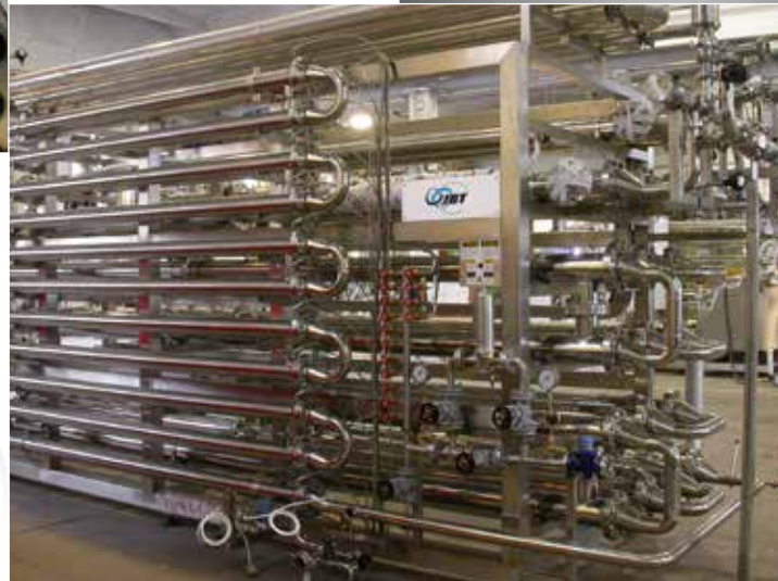
Sterideal® DR (Прямое восстановление)