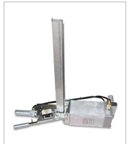
Modell F625LM für die Linkshandbedienung